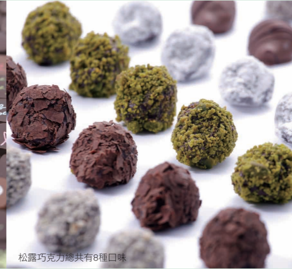
松露巧克力總共有8種口味

啜一口奶泡綿密的卡布奇諾，時空彷彿轉換到巴黎街頭。焦糖卡士達酥派(Marion)的千層派皮，搭配表面烤微焦的薄脆焦糖，中間夾著不甜不膩的卡士達，一口咬下的酥脆口感，散發出淡淡堅果香氣與焦糖甜味，豐富的層次變化，令人唇齒留香，回味無窮，搭配一杯Mariage Frères的錫蘭紅茶，享受最幸福的下午茶時光。