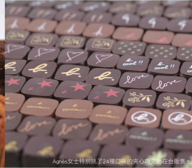
Agnès女士特別挑了24種口味的夾心巧克力在台販售。