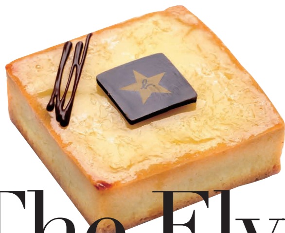
檸檬塔 (Ophélie)，以檸檬原汁、蛋黃、甜麵團製成。