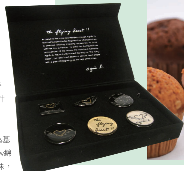
特別為The Flying Heart 微風店設計的胸針組