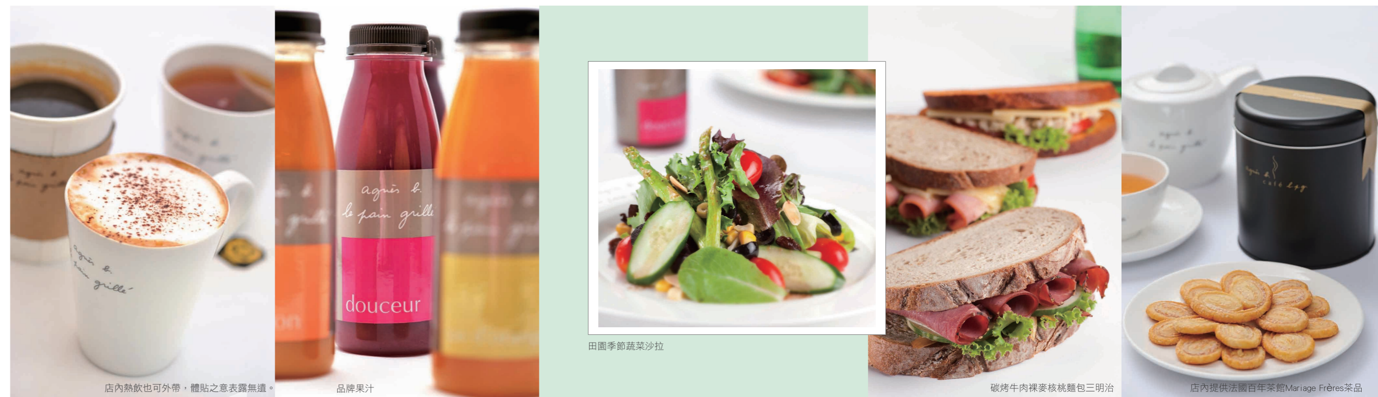
店內熱飲也可外帶，體貼之意表露無遺。

最受歡迎的首推名為Valérie的栗子海綿蛋糕，鬆軟的海綿蛋糕為基底，以綿密的栗子泥包覆，中間夾層為杏仁、巧克力和marshmallow棉花糖製成的白色奶油，口感細緻層次分明，栗子散發著濃郁的香味，