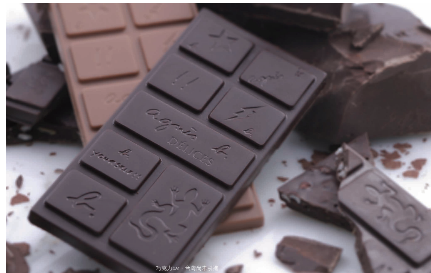
巧克力bar，台灣尚未引進