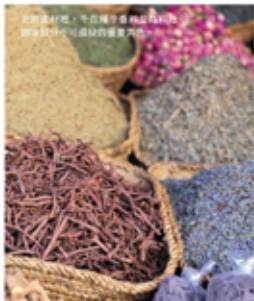
北非香料吧，午茶種字香精油和肉桂 如拿好計分可遠郊的靈芝肉桂。