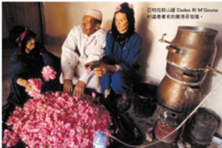
◎特拉布山區 Dades 和 M'Gouna 的這座電車的裝飾花匠在造。