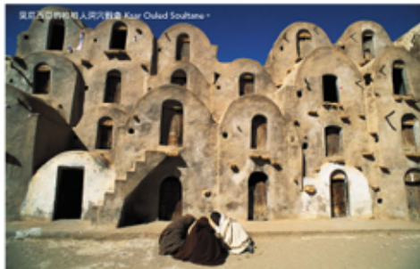
突尼西亞的柏柏人洞穴教堂 Kasbah of the Knights

伊菲蘭風情的建築特色之一，是擁有圓形的地盤學校。圖為馬拉喀什的 Ben Youssef Medersa 學校大門，歷經五個世紀的拱門雕刻，配上令人眼花撩亂的瓦工圖案，展現引領設計界發展成果。