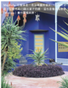
Mogador 摩加多爾是一座法國屬地，於1956年獨立之後，柏柏人開始遷出穴居的窟，這也是摩洛哥許多 (Moroccan) 畫作靈感來源。