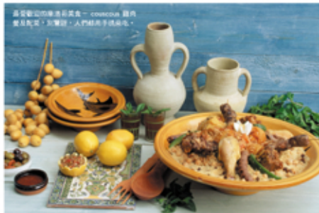
喜愛歡迎的摩洛哥美食——couscous 雞肉 雙豆配菜，五寶醬，人們稱之為「燒肉」。